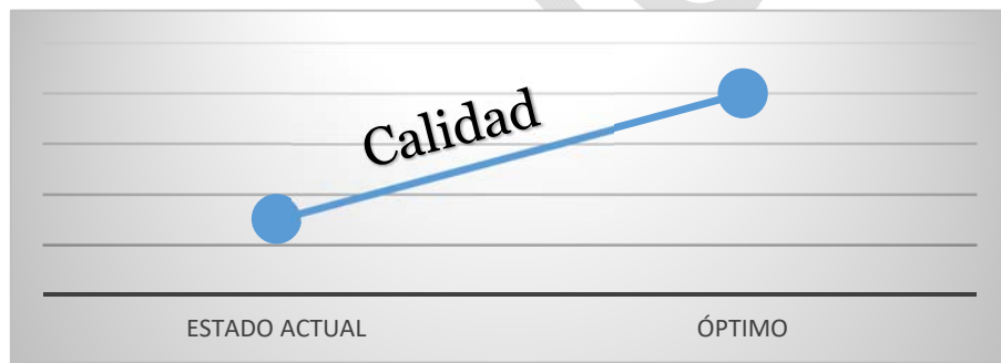
Figura 2 Definición de calidad

La autoevaluación mide “la distancia” entre el modo como un programa académico presta el servicio de la educación superior y el óptimo que corresponde a su naturaleza. Esta distancia determina la calidad del programa .